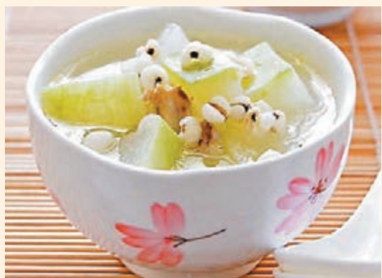
濕疹病因因應體質選擇適合自己的湯水。

以下推薦兩款湯水，第一款可改善脾胃虛弱濕氣增加，適合容易復發濕疹病人。另外一款湯水，適合肝胃火熱，皮膚滲出黃水的病人。