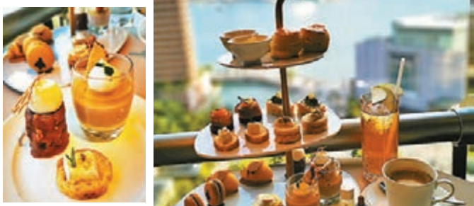
龍眼蜜入饌鹹點與甜點

「The Beauty and The Bee 夏蜜蜂姿」香檳下午茶，夾有絲滑榛子內餡，再綴以金黃朱古力片，酥香的牛油與堅果香互融，是午後的滋味良伴。