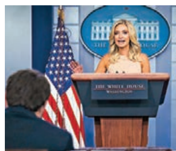
■ 麥克納尼最初一度稱特朗普未收過情報。

美國白宮對於總統特朗普是否知悉俄羅斯懸賞塔利班一事，各官員在不同時段皆有截然不同的說法，如特朗普本人抨擊媒體報道為「假新聞」，白宮發言人麥克納尼由最初稱特朗普未收過情報，到6月30日則改口成「地球上知得最多」；國家安全顧問奧布賴恩在同一日內的說法，亦從「不知情」變成「完全知情」。