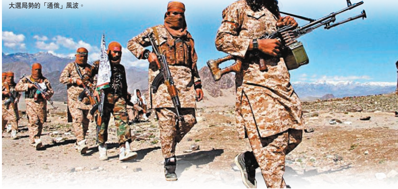
■ 俄羅斯軍情部門被指曾向塔利班有聯繫的銀行賬戶轉入大筆金額。圖為塔利班分子。

俄羅斯被指曾向阿富汗塔利班懸紅殺死美國軍人一事，繼續在美國政界發酵，白宮6月30日一度改口承認，總統特朗普的確曾閱讀過相關情報，甚至稱總統是「地球上知得最多的人」；民主黨議員6月30日就事件在白宮聽取報告後，指出特朗普一定知悉俄羅斯有嫌疑，卻沒有採取任何行動回應。事件令特朗普對俄態度再次引發爭議，有機會成為另一場左右大選局勢的「通俄」風波。