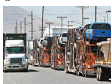
■ 3國貿易額跌至10年來最低水平。圖為美墨邊境。

不過新協定對3國、尤其是墨西哥的勞工保障有嚴格規定，由於墨西哥的新勞動法正面臨多項法律挑戰，一旦被推翻，墨西哥可能會被裁定為違反協定。此外，美國恢復對加拿大出口鋁10%關稅的計劃遭到加拿大反對。能源業方面，美國油企不滿墨西哥優待國營油企，違反協定中對私人投資者的保障，加拿大亦不滿墨西哥的新法例威脅對可再生能源的投資。