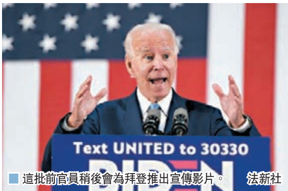
■ 這批前官員稍後會為拜登推出宣傳影片。