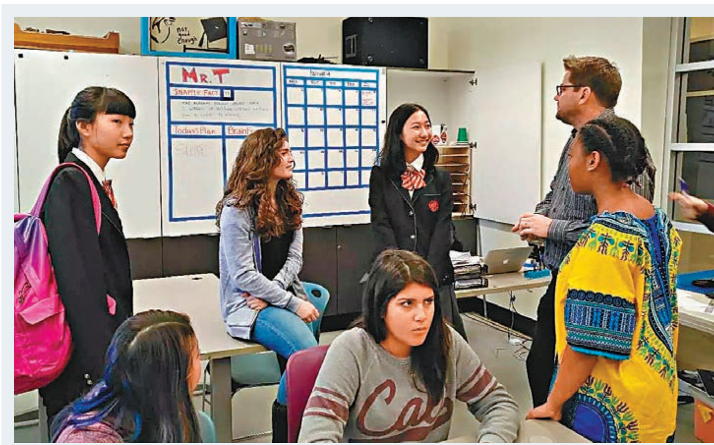
中國駐美大使館將安排包機，優先接未成年留美學生回國。圖為中國留美學生與當地同學和老師交談。網上圖片

中國民用航空局飛行標準司副司長韓光祖6日介紹，從3月4日到4月3日，民航共安排11架次臨時航班，協助在伊朗、意大利和英國的1,827名中國公民回國，接回人員主要以留學生為主。