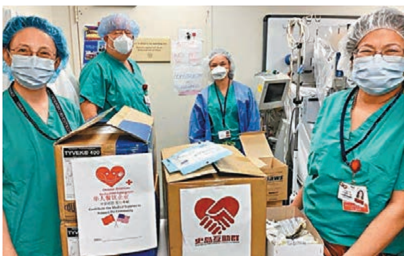
紐約市史坦頓島醫護人員收到美國華人團體及華人企業捐贈的口罩。

受。我們搏鬥過，付出了巨大犧牲，所以我們慰藉和幫助，其中很多是美國人，很多是知這裡及世界各地抗擊疫情的艱難。我們銘紐約人。現在我們也願真誠回報他們的善記，在最困難的時候世界各地的朋友給了我意，與他們共渡難關。