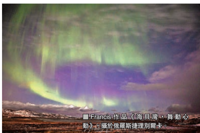
■Francis作品《海貝灣，舞動心動》，攝於俄羅斯捷理別爾卡。