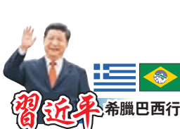
習近平 希臘巴西行

香港文匯報訊 據新華社報道，當地時間11月11日，中國國家主席習近平和夫人彭麗媛在希臘總理米佐塔基斯夫婦陪同下，共同參觀位於地中海地區的中遠海運比雷埃夫斯港項目，見證中希共商共建共享「一帶一路」成果。習近平表示，希望中希雙方再接再厲，搞好比雷埃夫斯港後續建設發展，實現區域物流分撥中心的目標，打造好中歐陸海快線。