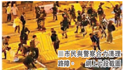
市民與警察合力清理路障。網上片段截圖

香港文匯報訊(記者文森)暴徒無情，人間有愛。過去兩天，黑魔發起所謂「黎明行動」，在全港多區堵路及破壞，令香港市民「被三罷」。不過，不少市民拒絕向惡勢力低頭，冒着被黑魔行私刑的生命危險，趁黑魔暫時撤離時，發揮互助互愛精神，自發清理路障，盡一分綿力，冀盼香港這個家能繼續正常運作。