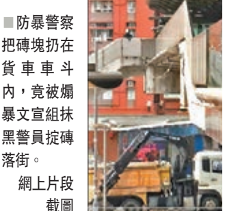
防暴警察把磚塊扔在貨車車斗內，竟被煽暴文宣組抹黑警員投磚落街。

在城大宿舍附近，一名外籍男子與眾人自發清理路障，他表示，自己在香港土生土長，非常喜歡這個家，拆除路障只為清理家園。他指理解部分香港人的示威理由，支持市民透過和平示威去爭取，但堵路及破壞等暴力行為並非正途，無助改善目前情況。