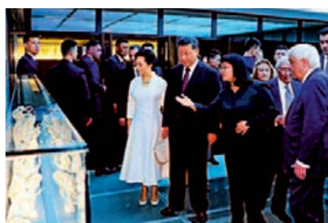
12日，習近平和彭麗媛參觀雅典衛城博物館。

習近平強調，今天的參觀給我留下了美好難忘的印象，使我加深了對古希臘文明的了解，感受到歷史的震撼，也進一步認識到中希作為兩大古老文明之間的諸多相通和相似之處。我們一道回味歷史，以古鑒今，展望未來，決定中希要更加緊密地攜手開闢更加美好的明天。雙方尤其要加強人文交流，倡導文明對話，為推動不同文明和國家包容互鑒、和諧共處，為促進世界和平繁榮，建設人類命運共同體作出應有的貢獻。