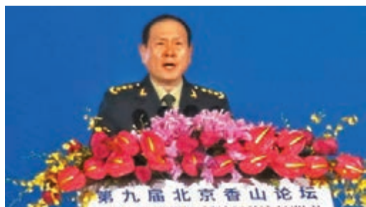
中國國務委員兼國防部長魏鳳和21日在第九屆北京香山論壇開幕式作主旨發言。中央社

習近平在賀信中強調，中國堅持以對話促合作、以合作促和平、以和平保發展。習近平指出，維護亞太地區持久和平安寧，符合地區國家共同利益，需要各國貢獻智慧和力量。面對複雜的安全威脅，各國要緊密團結起來，堅定維護以聯合國為核心的國際體系，不斷完善新型安全夥伴關係，推動構建符合地區發展實際的安全架構，更好促進亞太地區持久和平和普遍安全，為促進世界和平發展和構建人類命運共同體作出新的更大貢獻。