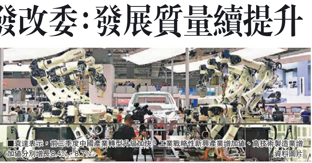
袁達表示，前三季度中國產業轉型升級加快，工業戰略性新興產業增加值、高技術製造業增加值分別增長8.4%、8.7%。資料圖片

西門子股份公司總裁兼首席執行官克澤爾建議，上海及長三角應依託自貿區創造的有利條件，利用便捷的運輸系統，大幅降低貿易成本，從而形成一個具有規模經濟和多元化特徵的城市集群、一個多元化產業協同集聚的主要平台，進而對全球總部經濟更具吸引力。