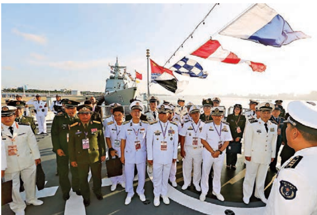
第九屆北京香山論壇21日在北京召開，中國國家主席習近平致賀信指出，各國要緊密團結，不斷完善新型安全夥伴關係，為促進世界和平發展和構建人類命運共同體作出新的更大貢獻。圖為中國—東盟「海上聯演—2018」演習去年在中國湛江舉行，東盟親摩國參觀中國軍艦。資料圖片

本屆論壇以「維護國際秩序，共築亞太和平」為主題，共有76個官方代表團、23國國防部長、6國軍隊總長(國防軍司令)、8個國際組織代表及專家學者和各國觀察員等1,300餘名嘉賓出席。