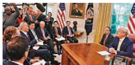
第十三輪中美經貿高級別磋商期間，特朗普在白宮會見劉鶴。資料圖片

任何國家都不可能退回自我封閉的孤島。對國際準則則合則用、不合則棄，是對國際秩序的嚴重衝擊。他說，大家對中美貿易摩擦很關注，貿易戰對兩國都不利，只有輸家沒有贏家。前不久的第三輪中美貿易高級別磋商，在一些領域取得實質性進展，我們願意在平等和互相尊重的基礎上，通過對話協商妥善解決彼此關切，防止摩擦升級擴散，這對兩國和世界都有好處。