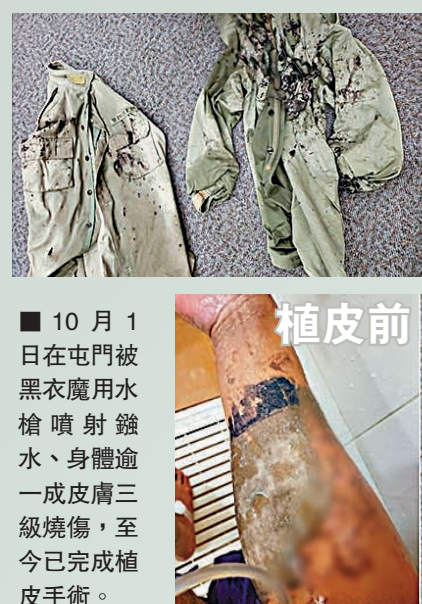
■ 10月1日屯門被黑衣魔用水槍噴射鏢水、身體逾一成皮膚三級燒傷,至今已接受植皮手術。

他們又在文中說,雖然現在是傷兵,但並無意志消沉,更想透過僅餘的力量,與同袍共同進退,也希望前線同袍花一兩分鐘時間,對現時各戰線、前線或行動中需要的裝備或裝備優化等問題有所建言,因為在兩人受傷期間,管方探訪時也表示不忍亦不希望再有同事受傷,亦希望更多了解前線裝備等問題,務求加快裝備分發和研製更強保護裝備,因為優質的防暴裝備可以更好地保護同事,也因為“生命無Take two”!