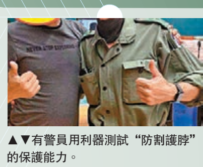
▲▼有警員用利器測試“防割護脖”的保護能力。