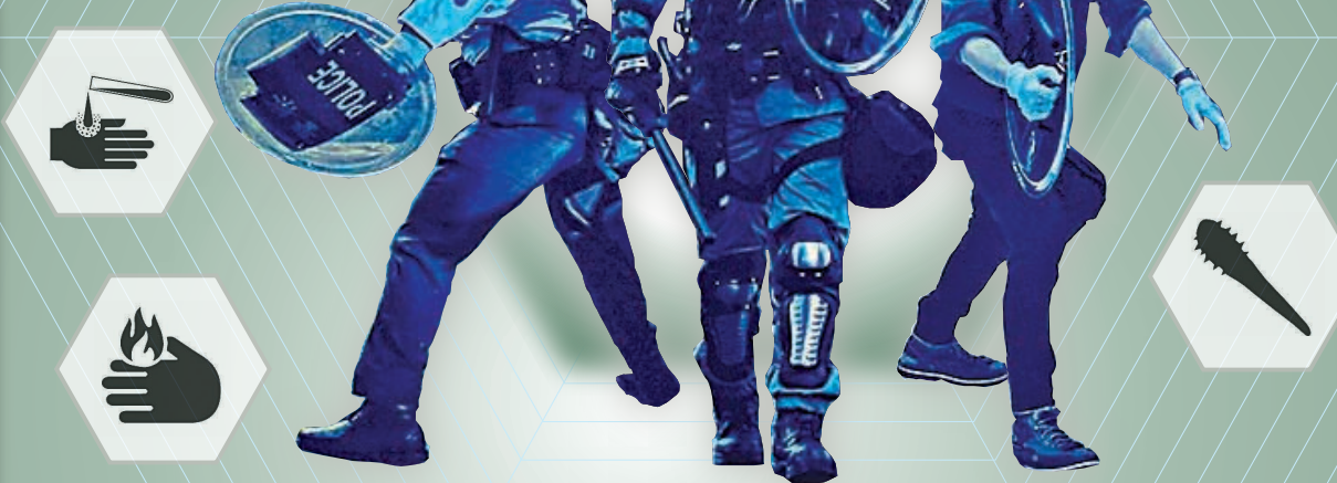
警隊於8月購買的500套新保護裝備

頻挨刀砸燒鏢蝕 前線嘆裝備不足 香港文匯報訊 (記者 蕭景源) 暴徒針對防暴警掀起一波又一波血雨腥風,有前線警員在探望受傷同袍後在網上發表感言,對近月同袍以血肉之軀抵擋刀刺、棍打、火燒、鏢蝕……感到痛心和憂心,並認為警隊是時候考慮加強警員的保護裝備。 面對暴徒不斷升級的暴力、不斷改良的致命武器,不斷地有同袍受傷流血,甚至命懸一線,但擺在面前的殘酷現實是,面對招招擇命的兇殘暴徒時,就算發射布袋彈、催淚彈等,也不能阻擋暴徒埋身攻擊,在大部分情況下,警員僅憑手上一根短短的警棍、一面薄薄的盾牌,還有盛載量有限的胡椒噴霧抵擋。 有前線警員在社交網站發帖指,現在的防暴裝備很沉重,且不靈活,在追捕暴徒時消耗體力,但在防線的另一邊,卻是身穿輕裝護甲的暴徒。他們手上有汽油彈、彈弓、鐵錘、土巴拿、弓弩、鏢水彈、棍棒、尖矛、取之不盡的磚頭,還有就地取材的鐵欄和任何物件,“當這些武器向我們襲來時,我們甚至沒有還手的餘地,鏢水濺到身上時我們甚至來不及脫掉衣服,磚頭飛來時,那面盾牌擋得住嗎?”“當我們下班時被暴徒認出來,對方拿着汽油彈、錘子、木棍像雨點一般砸過來時,難道我手裡那根警棍可以擋下這一切?”該名警員強調,防護裝備對前線警員實在太重要,警隊是時候考慮加強保護裝備:“有沒有人能夠明白我們的裝備真的不夠用呢?” 該警員在文中寫到,在探望過被鏢水重創同袍後,被他們的堅強意志和不屈不撓的精神所感動,也對受傷和前線同袍的一腔熱血、威武不屈感到振奮。迎着烈火,面對利刃,香港警察雖被百般刁難,仍忍辱負重,哪怕被鏢水腐蝕肌膚也依然無懼無畏。