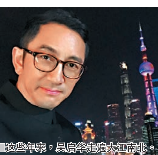
这些年来，吴启华走遍大江南北。网上图片