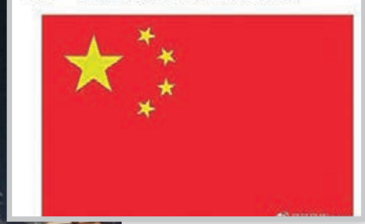
吴启华的爱国言论获广大网友支持。