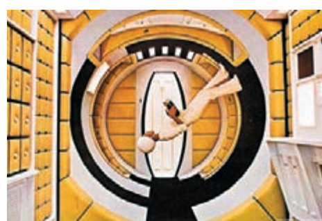
■ 《2001太空漫游》的镜头如诗如画。

展览设于伦敦设计博物馆。一踏入展馆大门，首先看到《闪灵》里那幅令人心惊肉跳的橙红色六角形地毯、听到《2》里太空漫游的美妙配乐，还有原装电影海报、陈旧的