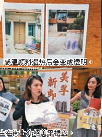
■ 感温颜料遇热后会变成透明。