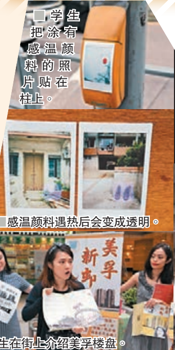
■ 学生把涂有感温颜料的照片贴在柱上。