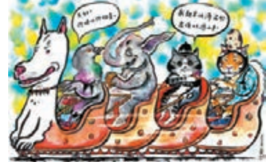
■ 李香兰《飞龙过山车——美好时光》