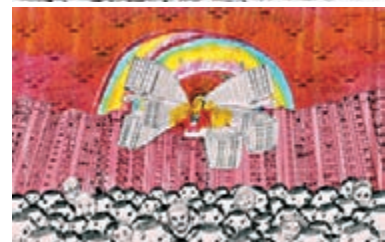
■ 罗文乐《美荔神奇风景（甲）》