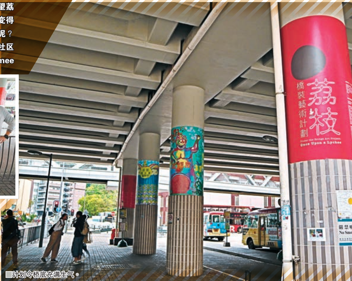
■ 计划令桥底充满生气。

荔园游乐场，相信是很多港人的回忆，它位于荔枝角湾畔，所以每当说起荔枝角，少不免联想起荔园，而是次柱身的创作灵感，艺术家们都不约而同地以荔园的游戏设备为创作题材，希望借此更能带出街坊们的共鸣。各个艺术家在创作桥底艺术作品前，也曾亲身和桥底附近的居民做访问收集意见，更将其意见融入在桥底艺术中，在八条桥底柱身中，则有其中一条柱身详细列出访问的结果，当中可见大部分居民认为红色、圆形等颜色和图形最易令人联想起荔枝角，因此是次艺术家的作品也不乏这些元素。