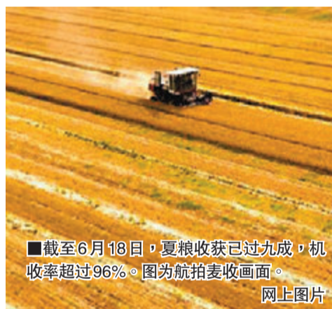
截至6月18日,夏粮收获已过九成,机收率超过96%。图为航拍麦收画面。

5月份,中国大宗农产品价格总体稳定,水果、猪肉、鸡蛋价格同比涨幅较大。5月份农业农村部监测的6种水果均价每公斤7.55元(人民币),环比上涨19.5%。猪肉价格涨幅较大,同比上涨26.6%。鸡蛋价格连续两个月小幅上涨,同比上涨9.1%。