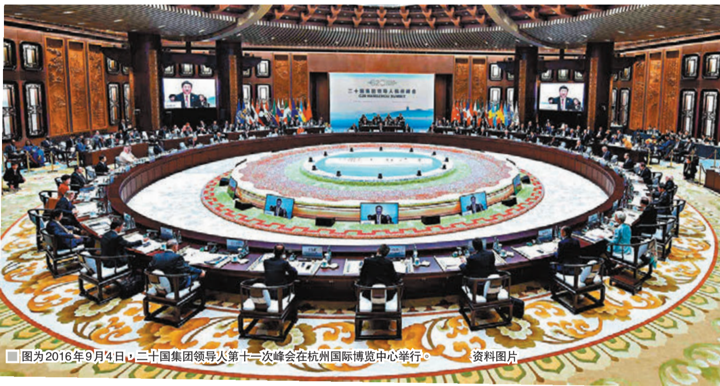
图为2016年9月4日,二十国集团领导人第十一次峰会在杭州国际博览中心举行。资料图片