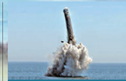
巨浪-2弹道导弹(代号：JL-2)

研制时间：1967年-1989年 定型时间：1991年2月 服役时间：1991年 导弹射程：2,700公里(改进后) 命中精度：300-400米 弹头：1枚20万至100万吨当量核弹头，无分弹头 发射平台：092型战略核潜艇(夏级)