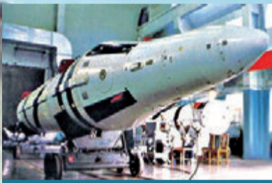
巨浪-1弹道导弹(代号：JL-1)

研制时间：1967年-1989年 定型时间：1991年2月 服役时间：1991年 导弹射程：2,700公里(改进后) 命中精度：300-400米 弹头：1枚20万至100万吨当量核弹头，无分弹头 发射平台：092型战略核潜艇(夏级)