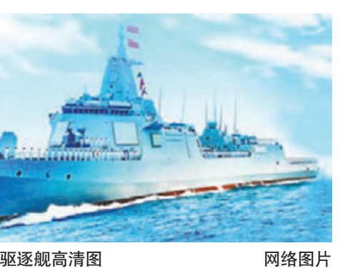
▲网友23日上传的055型驱逐舰高清图

统，配备112单元通用垂直发射系统。除首舰南昌舰即将下水外，二、三、四号舰已先后下水。南昌舰于2017年下水，外界猜测其