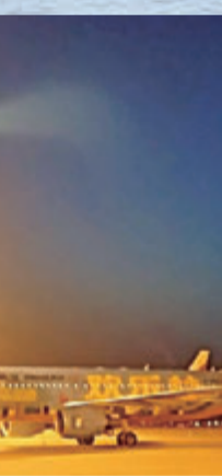
▲6月2日凌晨，解放军疑似试射新型潜射型巨浪-3导弹，飞行轨迹一度被目击者误认为不明飞行物所致 资料图片

在海、陆、空基三位一体核威慑之中，海基战略核力量由于其超强的隐蔽性和机动性，是二次核打击的支柱，也具有最强的核威慑效果。知名军事专家、凤凰卫视评论员宋忠平认为，未来巨浪-3若能与中国新一代096型战略核潜艇结合，并且形成战斗力进行战备值班，将能够发挥出最大的优势，令中国的战略核武器，尤其是海基的战略核武器，形成更强的实战能力，更具战略威慑力。