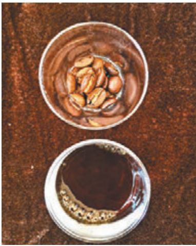
■雲南精品豆和咖啡。

中，中國的產量為13.2萬噸，排在全球第九位。雖然與排名第一的巴西相差甚遠，不過中國也躋身成為了世界咖啡的主產區。 據普洱市茶葉和咖啡產業發展中心統計，2017至2018年採摘季，普洱市咖啡產量6萬噸，綜合產值24億元（人民幣，下同），其中工業產值9.8億元，第三產業產值5.3億元。每年在普洱交易的咖啡超過10萬噸，出口30多個國家和地區，普洱已成為中國種植面積最大、產量最高、品質最優的咖啡核心主產區和貿易集散地。普洱市委書記衛星說，下一步要努力把普洱打造成中國最大的咖啡生產基地、亞洲最好的咖啡交易中心、世界優質咖啡原料供應基地。