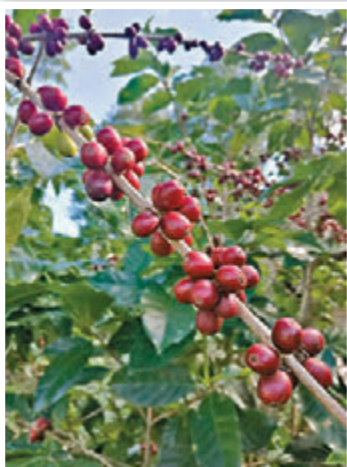
▲雲南普洱咖啡果。