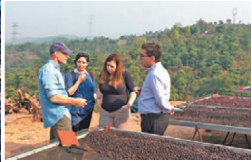
▲每年咖啡成熟季，是吸引世界各國的業內人士來到普洱尋找優質咖啡的好季節。