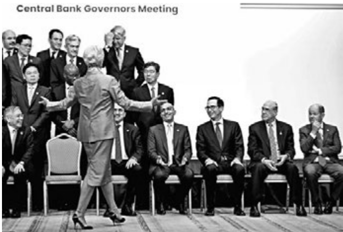
■G20 首次談論人口老化及出生率下降的風險。