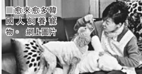
■愈來愈多韓國人飼養寵物。 網上圖片

現代社會養育子女開支極大，往往費盡心力，令不少人打消生育下一代的念頭，改為飼養寵物，甚至如家人般看待牠們。以韓國為例，擁有寵物的家庭比率從2012年的18%，增至去年的28%，寵物護理行業市場總值估計到2027年將再增加逾一倍。