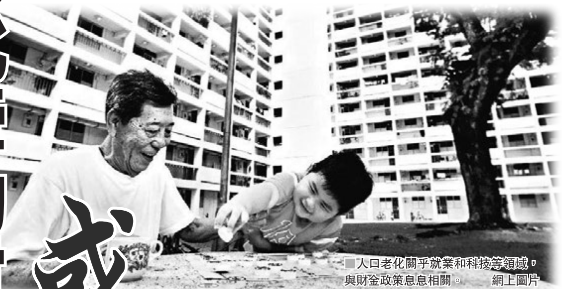
■人口老化關乎就業和科技等領域，與財金政策息息相關。