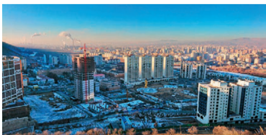
▲在翟山纪念碑俯瞰乌兰巴托市