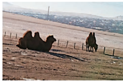
▲这些骆驼可供游客骑着合照或喂饲