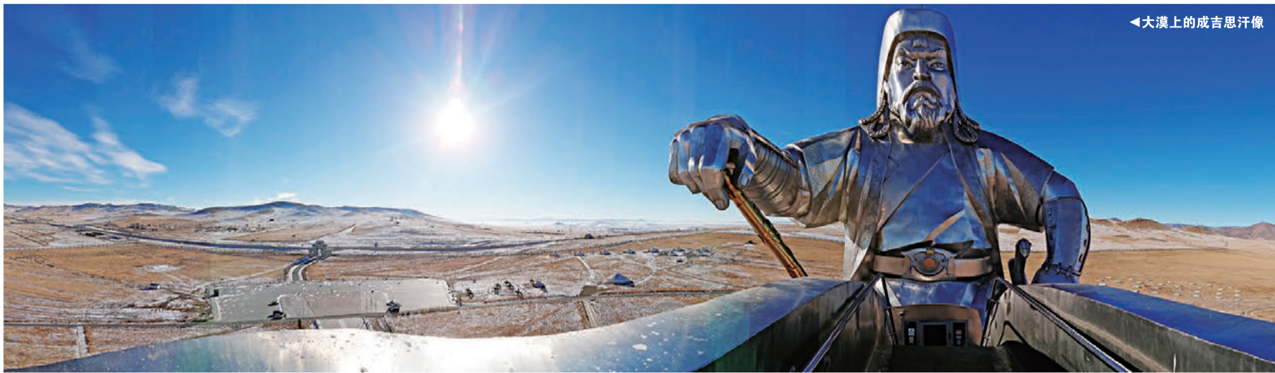
◀大漠上的成吉思汗像

行色匆匆，结束行程之时，忘不了的是不知吃了多少餐的羊肉、饺子，以及满脑子的成吉思汗，返回香港。