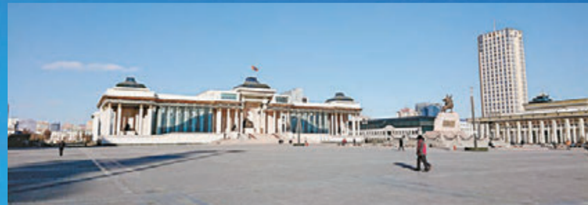
▲国会大厦位于成吉思汗广场