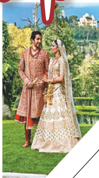
原來印度婚禮很多禮節要做。

了3天，有到當地博物館遊覽。然後就趕回香港拍懷舊動作片《唐人街》，因為今次在新劇中飾演殺手，強項係起飛跳，要苦練『十二路譚腿』去應付打戲，成日打到傷晒，唔適宜懷孕。所以不用問我有沒有在羅馬造人了，哈！哈！等遲些再拍完另一套劇，先開始調理身體，『造人』大計下一年再想。」