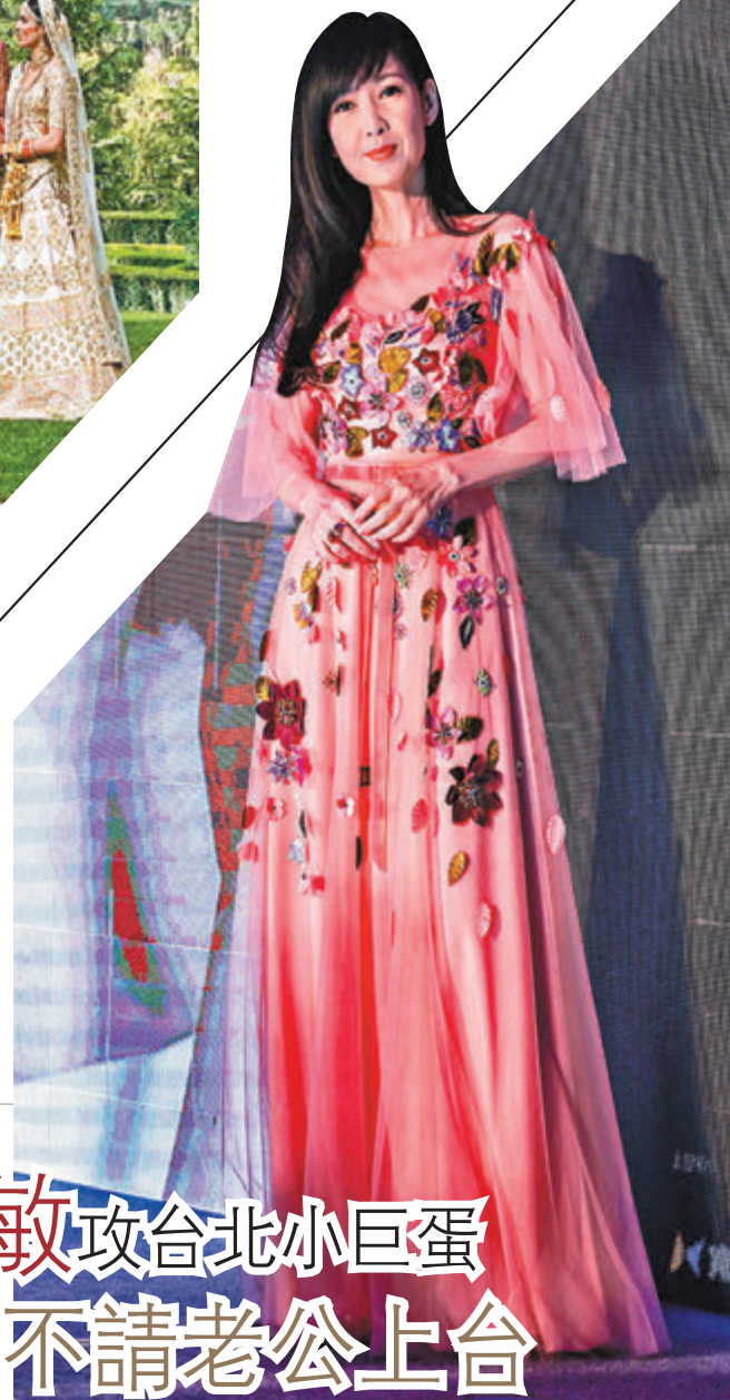
周慧敏宣傳8月將在台北小巨蛋舉辦30周年演唱會。