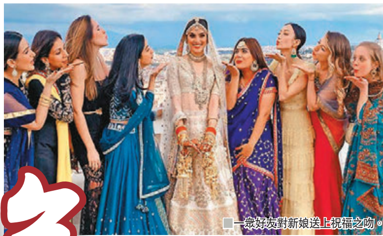
一眾好友對新娘送上祝福之吻。