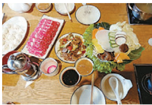
▲羊肉、饺子是蒙古的家常食物

刚抵埗，便已迫不及待想着回程的安排，这到底是一个怎样的旅程。然而，人纵使疲惫，在乌兰巴托的第一个晚上，竟然辗转难眠，遇上久违了的失眠，只因为鼻子实在适应