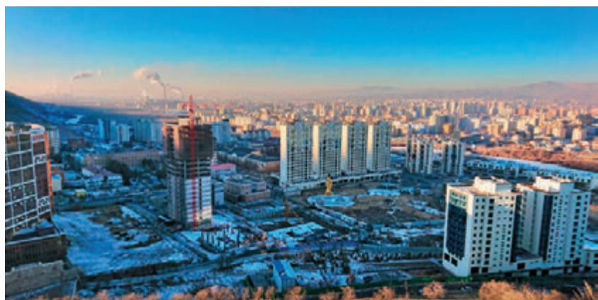
▲在翟山纪念碑俯瞰乌兰巴托市