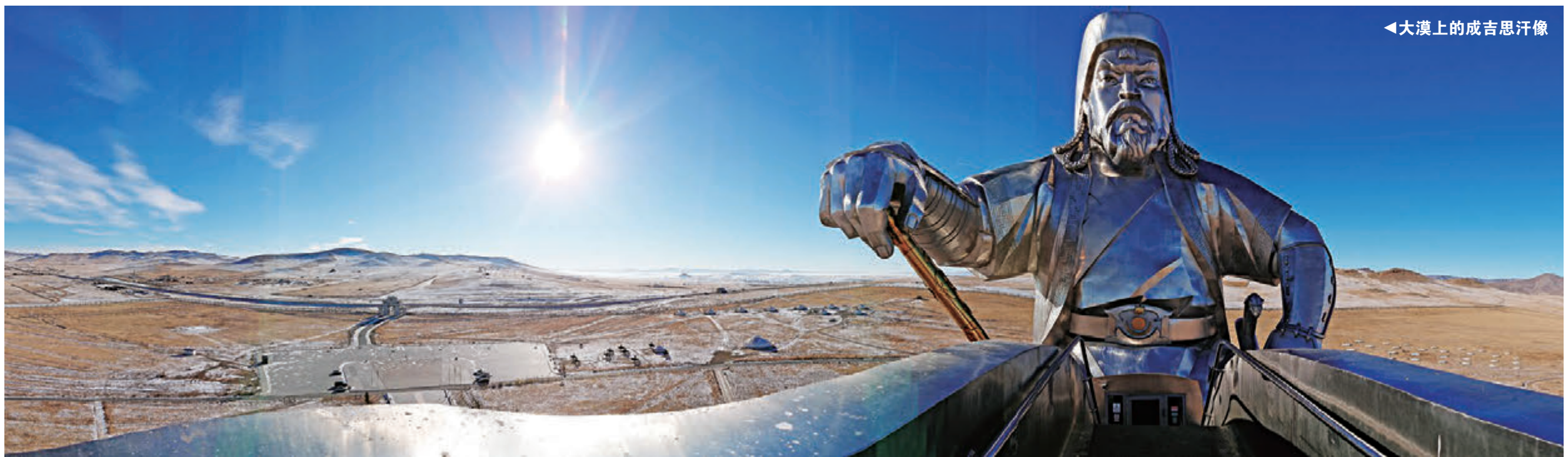
◀大漠上的成吉思汗像

行程匆匆，结束行程之时，忘不了的是不知吃了多少餐的羊肉、饺子，以及满脑子的成吉思汗，返回香港。