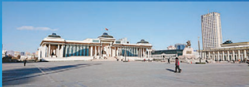
▲国会大厦位于成吉思汗广场