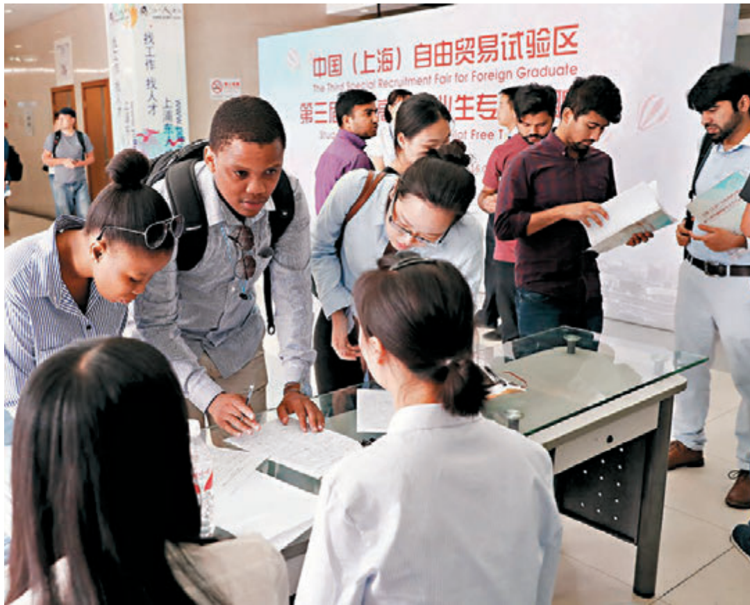
■上海科改「25條」允許持有永久居留身份證的外籍人才擔任新型研發機構法定代表人，牽頭承擔政府科研項目。圖為去年上海舉行外籍人才專場招聘會。

另外，吳清還表示，要以上交所設立科創板並試點註冊制為契機，支持優質科創企業上市。上海將進一步深化金融中心、科創中心的聯動，進一步做好「蓄水池」服務工作，推動一批符合條件的科創企業能夠上市，同時也為科創板培育源源不斷、優質上市資源等。