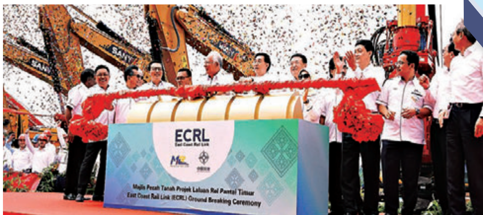
马来西亚总理纳吉布保证,该计划会在2024年完工,届时可带动彭亨、登嘉楼及吉兰丹这三个东海岸州属的经济发展,也有助减缓马六甲海峡的繁忙情况。2018年,马哈蒂尔再次执政,搁置超过200亿美元的中国承建的基础项目,其中包括由吉隆坡至新加坡的高铁以及大马东海岸铁路的建设。

近年来,大马东海岸铁路项目可谓一波三折。2016年,时任马来西亚总理纳吉布发表财政预算案时宣布东海岸铁路造价为550亿令吉。2017年8月,中国投资合作、全长逾600公里的马来西亚半岛东海岸铁路举行动工仪式。