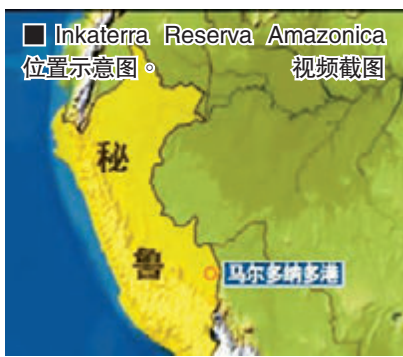
Inkaterra Reserva Amazonica 位置示意图。资料图片