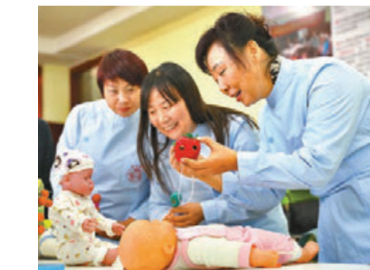
李克强要求部署推动家政服务增加供给,图为学员在妇女就业培训中心接受育婴培训。资料图片

韩长赋表示,一号文件对新一轮农村改革作出部署,处理好农民和土地的关系仍然是深化农村改革的主线,要以土地制度改革为牵引推进农村改革。其中,农村土地征收、集体经营性建设用地入市和宅基地制度改革正在继续深化的农村土地制度改革。