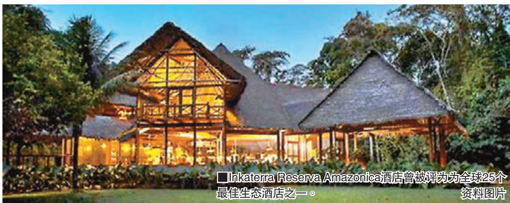
Inkaterra Reserva Amazonica酒店曾被評為全球25个最佳生态酒店之一。资料图片