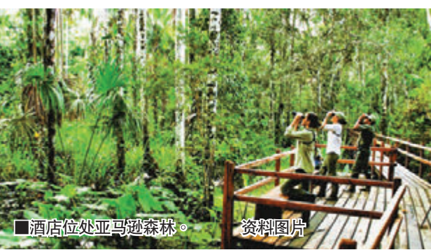
酒店位处亚马逊森林。资料图片