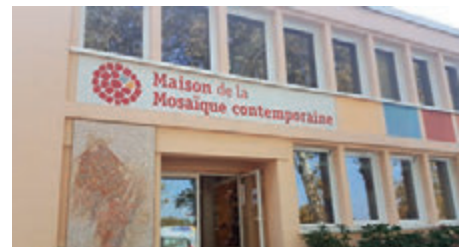
▲主办会议的当代马赛克社区外墙装饰了马赛克，凝聚热爱马赛克的人