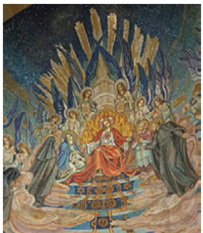
▲在La Colombière Chapel内的大型马赛克壁画，描写修女Magaret见到神迹的传说