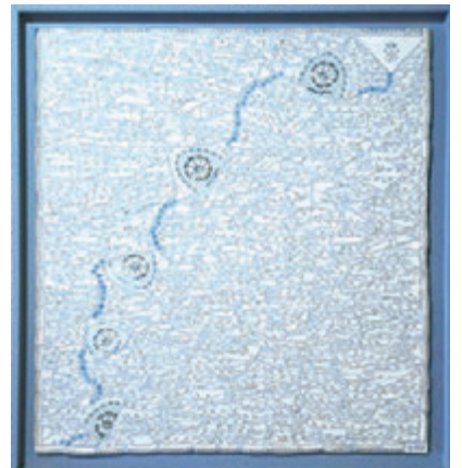
▲Line Mosur的《Cerf Volant》用法国瓷器拼砌出跳脱又和谐线条