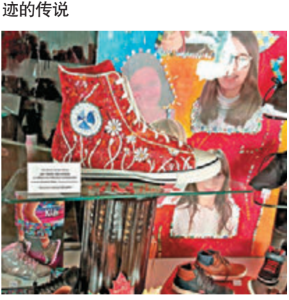
▲看真点，鞋店的橱窗有对超大的马赛克球鞋，以贺马赛克会议在当地举行