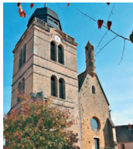
▲位处城中心的圣尼古拉斯塔是今届马赛克联展的展场

二〇二〇年，该协会第十七届会员大会将于意大利西西里岛举行。我们约定了，到时再见！