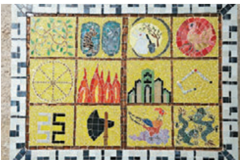
▲我的作品《十二章文》分享中华文化