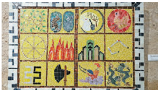
▲我的作品《十二章文》分享中華文化