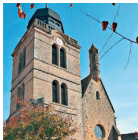
▲位處城中心的聖尼古拉斯塔是今屆馬賽克聯展的展場

二〇二〇年，該協會的第十七屆會員大會將於意大利西西里島舉行。我們約定了，到時再見！