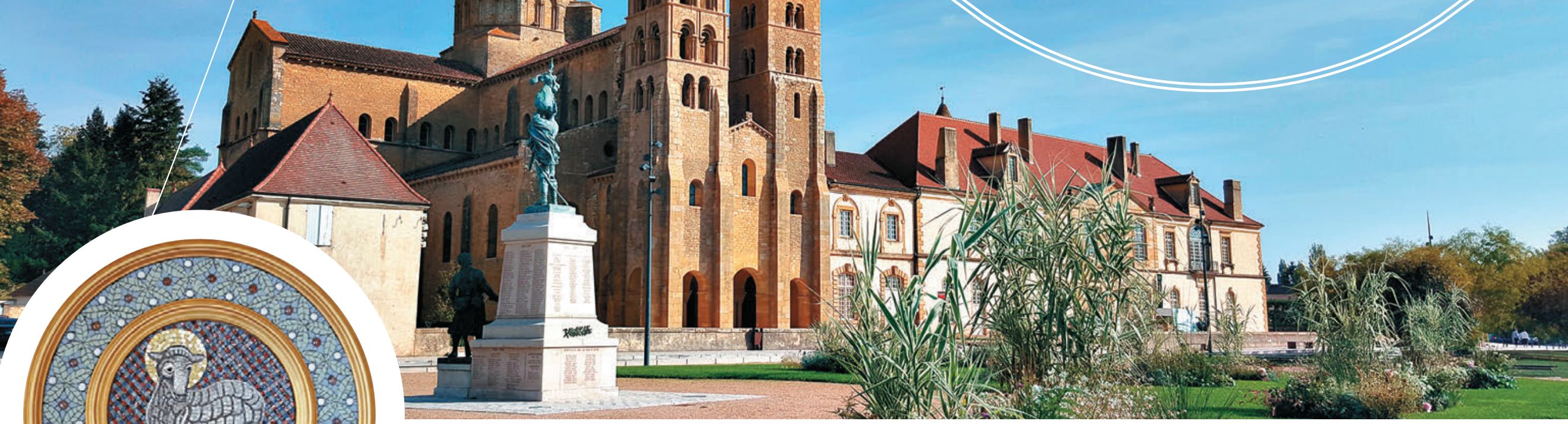
▲宏偉的聖心大教堂是帕萊蒙尼亞勒標誌性建築