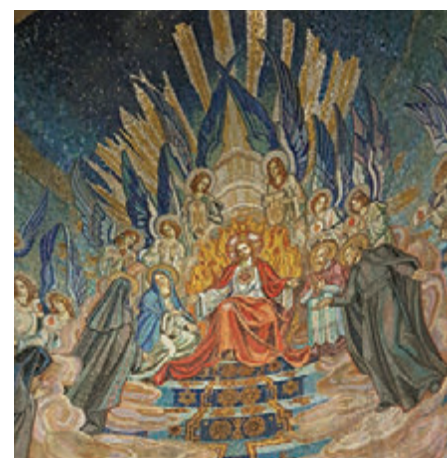
▲在La Colombière Chapel內的大型馬賽克壁畫，描寫修女Magaret見到神跡的傳說