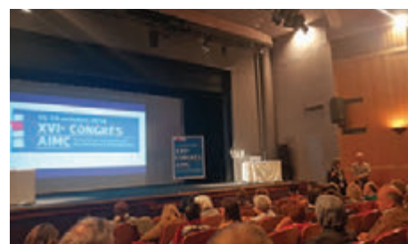
▲國際當代馬賽克藝術家協會第十六屆會議

協會的精神是宣揚當代馬賽克，聯繫馬賽克藝術家，並且建立一個開放給會員、學者、學校及藝術支持者的馬賽克檔案中心。