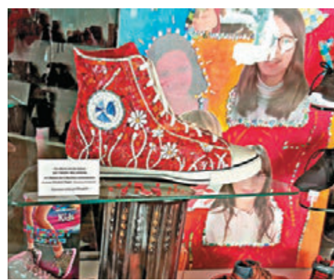
▲看真點，鞋店的櫥窗有對超大的馬賽克球鞋，以賀馬賽克會議在當地舉行