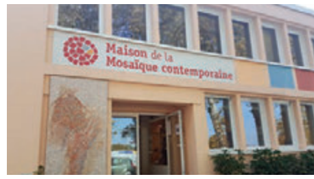
▲主辦會議的當代馬賽克社區外牆裝飾了馬賽克，凝聚熱愛馬賽克的人

該協會每隔兩年舉行一次年會，成立以來已輪流在十三個國家舉行了十六屆會議。會員來自四十個國家。每屆會議都與藝術學院、機構、博物館合作，過程中會員了解不同國家的文化藝術精髓。