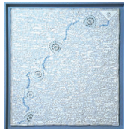
▲Line Mosur的《Cerf Volant》用法國瓷器拼砌出跳脫又和諧的線條