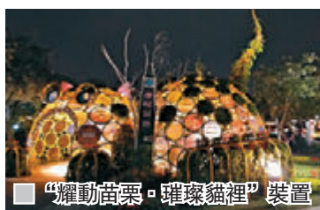
■“耀動苗栗·璀璨貓裡”裝置

二區的競賽園區,展示了很多作品,如屋頂上的野餐、竹報平安、綠藝人間等,各有特色。其後穿梭於浪漫花廊道,是全台最長的花廊道,猶如走進花海隧道中,你可欣賞各式各樣的美麗花卉。而第四區,則最有特色的竹跡館,亦是最多遊客的地方,如想拍較少遊客的相片,建議可於較晚的時間進入。晚間的竹跡館真的很美,筆者覺得比日間更美。