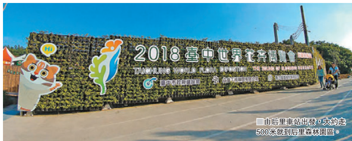
■由后里車站出發,大約走500米就到后里森林園區。

由香港飛台中,以華信航空為例,每天大約有四班。如你一行多人是搭早班10時10分的飛機,由於花博位於豐原及后里,與台中清泉崗機場其實也很近,也不妨包車先去豐原葫蘆墩公園一遊,因這個園區是免費的。不過,筆者是搭較晚的飛機,就沒有採用這方法,直接先回酒店休息。現在,以台中大毅老爺行旅出發為例,分享筆者搭車的方法,以及遊園區注意的事項,同時為大家展示一些筆者較喜歡的展館、庭園、公共藝術及裝置藝術等。