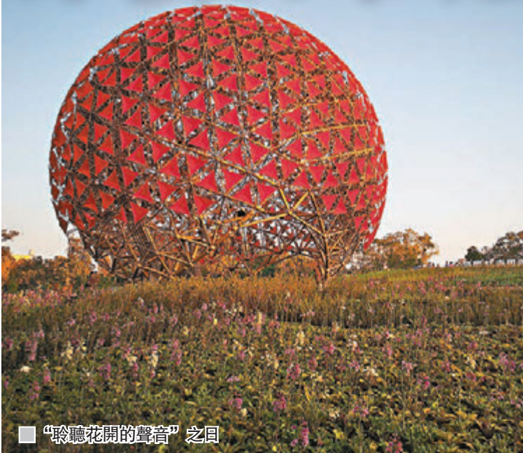
■“聆聽花開的聲音”之目

由香港飛台中,以華信航空為例,每天大約有四班。如你一行多人是搭早班10時10分的飛機,由於花博位於豐原及后里,與台中清泉崗機場其實也很近,也不妨包車先去豐原葫蘆墩公園一遊,因這個園區是免費的。不過,筆者是搭較晚的飛機,就沒有採用這方法,直接先回酒店休息。現在,以台中大毅老爺行旅出發為例,分享筆者搭車的方法,以及遊園區注意的事項,同時為大家展示一些筆者較喜歡的展館、庭園、公共藝術及裝置藝術等。