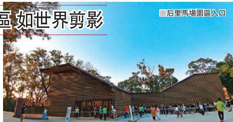
■后里馬場園區入口

不過,在這區裡,筆者較喜歡室外的“國際庭園”,不同國家及地區所建成的花園,如不丹、日本、哈薩克、韓國、馬來西亞、緬甸、阿曼、巴基斯坦、新