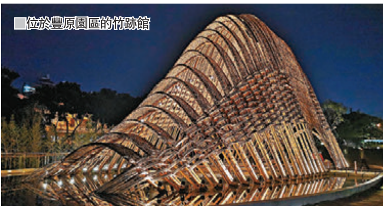
■位於豐原園區的竹跡館