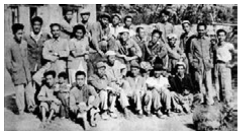
■1945年延安魯藝美術部部分師生合影。曾經的魯藝學員對後來的中國美術界產生了深遠影響。