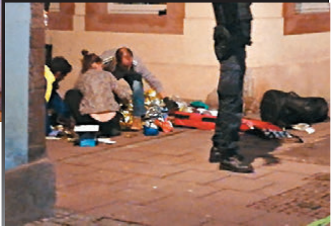
■ 救援人员抢救伤者。