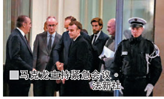
■ 马克龙主持紧急会议。