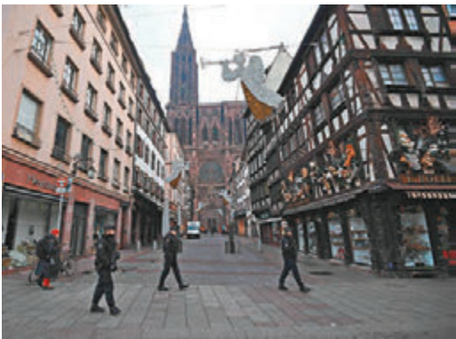
■ 警方事发后加强巡逻。

与德国只有一河之隔的斯特拉斯堡，在法国有“圣诞之都”之称，原因在于当地圣诞市集已有450年历史，是法国以至欧洲最古老的圣诞市集。每年11月底开始的圣诞市集都会吸引约300个摊档入驻，售卖应节商品，加上场内巨型圣诞树和灯饰，去年约220万名游客慕名入场。