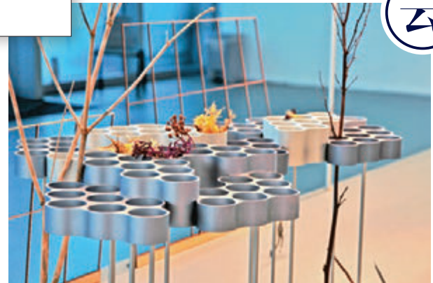
▲“云”以布鲁莱克兄弟标志性云状设计建立建筑与自然间的微妙联系