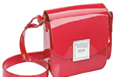
▲红色小手袋外形别致，最适合调皮女生出席派对及节日活动

时尚实用的小手袋Zaxy Power Bag，盒形设计，简约型格之余不乏可爱格调。盒子虽小，容量却不小，少女的出街装备统统能装载其中。手袋的外形线条流畅，磁石扣的位置以品牌的银色名牌作点缀，最适合追求细节的完美主义者。金属再配合品牌的专利亮面塑胶，不但可以点亮少女的整个造型，更能配合出席各大派对和节日活动。查询可电：3514-9338。