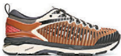
▲GEL-DELVA I以立体镂空网面材料包裹鞋面，型格十足

此次Kiko将品牌的越野跑鞋GEL-FUJI TRABUCO 7鞋面与经典长距离跑鞋GEL-KAYANO 24外底及后跟结合，并以特制的立体镂空网面材料包裹鞋面，透出若隐若现的品牌虎爪纹，再配合科技，带来更舒适的穿着体验。至于服饰系列，包括三组配色的紧身长袖上衣和紧身裤，适合在冬季进行多层造型搭配。查询可电：2118-2288。