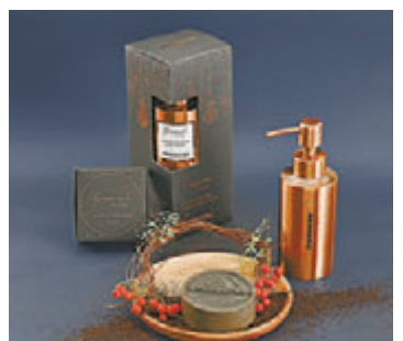
▲咖啡渣洁手套装包括以咖啡渣制作的洗手液以及咖啡渣手工皂

另外，咖啡渣洁手套装于11月21日推出，收入扣除成本将全数支持香港本地耕作的发展。