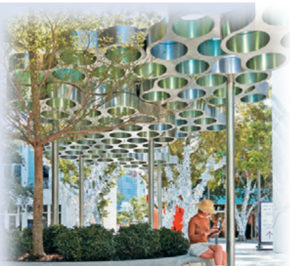
▲多功能公共空间“亭子”是第一件被应用到现实中的作品