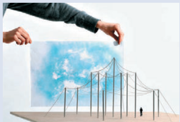
▲此次展出的方案自由、灵活，充满创新

作为国际知名的设计师，布鲁莱克兄弟曾获得包括2016年度Wallpaper*设计大赏（Wallpaper Design Awards 2016）年度最佳设计师在内的众多奖项，“梦建城市”是他们首次涉猎城市发展新形态，他们用详细的城市规划实例，将树木、动物、水及火等自然元素带回市区，重新探索都市中建筑物、行人路、喷泉等公共设施与树种种植间的关系，从多方面探讨环境保育的问题。其中多个设计已在世界不同城市中实现，由梦想照进现实。