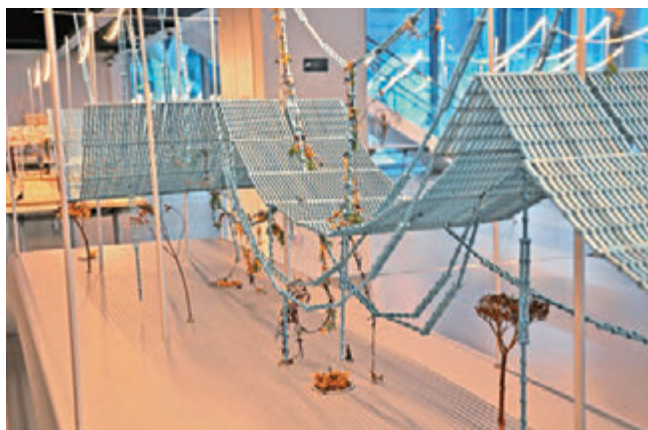
▲展品“凉棚”，以铁链打造遮荫通道