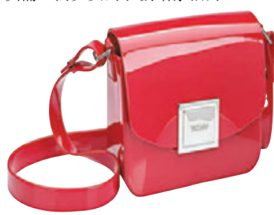
▲紅色小手袋外形別致，最適合調皮女生出席派對及節日活動

時尚實用的小手袋Zaxy Power Bag，盒形設計，簡約型格之餘不乏可愛格調。盒子雖小，容量卻不容小覷，少女的出街裝備統統能裝載其中。手袋的外形線條流暢，磁石扣的位置以品牌的銀色名牌作點綴，最適合追求細節的完美主義者。金屬再配合品牌的專利亮面塑膠，不但可以點亮少女的整個造型，更能配合出席各大派對和節日活動。查詢可電：3514-9338。