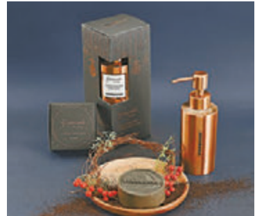
▲咖啡渣潔手套裝包括以咖啡渣製作的洗手液以及咖啡渣手工皂

12個聖誕妙用咖啡渣的主意，可瀏覽香港星巴克網站： http://www.starbucks.com.hk/promo/groundsforjoy 。另外，咖啡渣潔手套裝於11月21日推出，收入扣除成本將全數支持香港本地耕作的發展。