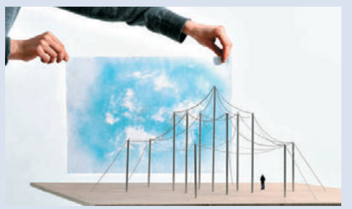
▲此次展出的方案自由、靈活，充滿創新

作為國際知名的設計師，布魯萊克兄弟曾獲得包括2016年度Wallpaper*設計大賞 (Wallpaper Design Awards 2016) 年度最佳設計師在內的眾多獎項。「夢建城市」是他們首次涉獵城市發展範疇，他們以想像中的各種城市新形態為主題，用詳細的城市規劃實例，將樹木、動物、水及火等自然元素帶回市區，重新探索都市中建築物、行人路、噴泉等公共設施與樹林種植間的關係，從多方面探討環境保育的問題。其中多個設計已在世界不同城市中實現，由夢想照進現實。