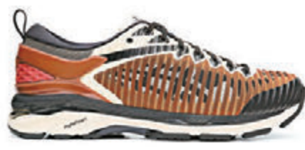
▲GEL-DELVA I以立體鏤空網面材料包裹鞋面，型格十足

此次Kiko將品牌的越野跑鞋GEL-FUJI TRABUCO 7鞋面與經典長距離跑鞋GEL-KAYANO 24外底及後跟結合，並以特製的立體鏤空網面材料包裹鞋面，透出若隱若現的品牌虎爪紋，再配合科技，帶來更舒適的穿着體驗。至於服飾系列，包括三組配色的緊身長袖上衣和緊身褲，適合在冬季進行多層造型搭配。查詢可電：2118-2288。