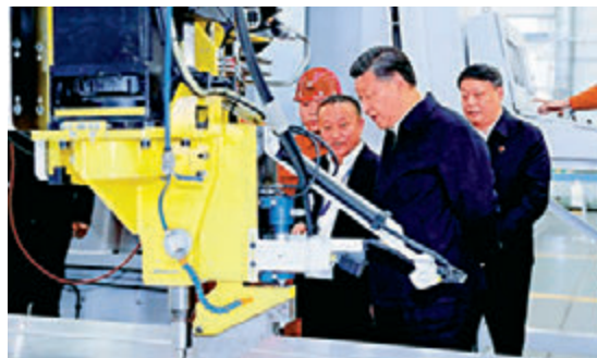
▲习近平在辽宁忠旺集团生产制造车间参观 资料图片

“万企帮万村”行动由全国工商联、国务院扶贫办、中国光彩会于2015年10月发起，以民营企业为帮扶方，以贫困村、贫困户为帮扶对象，目标是用3到5年，动员全国1万家以上民营企业，帮助1万个以上贫困村加快脱贫进程。截