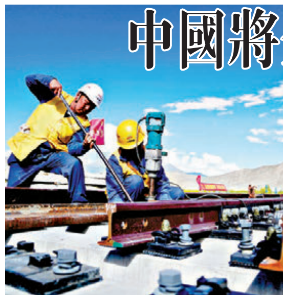
■工人在川藏鐵路拉林段首個新建車站，真嘎車站鋪設道岔。

香港文匯報訊 據新華社報道，中共中央總書記、國家主席、中央軍委主席、中央財經委員會主任習近平10日下午主持召開中央財經委員會第三次會議，研究提高中國自然災害防治能力和川藏鐵路規劃建設問題。