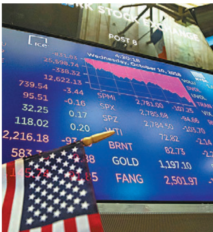
■美股10日大幅走低，拖累亞太市場11日全線下挫。

受隔夜美股大跌影響，亞太股市11日全線收跌。韓國綜合指數跌4.44%，報2,129.74點，創一年半收盤新低。日經225指數跌3.89%，報22,590.86點，創一個月收盤新低。澳大利亞ASX200指數跌2.74%，報5,883.80點，創六個月收盤新低。新西蘭NZX50指數跌3.64%，報8,721.20點，創四個月收盤新低。