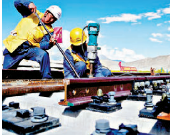
■工人在川藏鐵路拉林段首個新建車站，貢嘎車站鋪設道岔。

香港文匯報訊 據新華社報道，中共中央總書記、國家主席、中央軍委主席、中央財經委員會主任習近平10日下午主持召開中央財經委員會第三次會議，研究提高中國自然災害防治能力和川藏鐵路規劃建設問題。