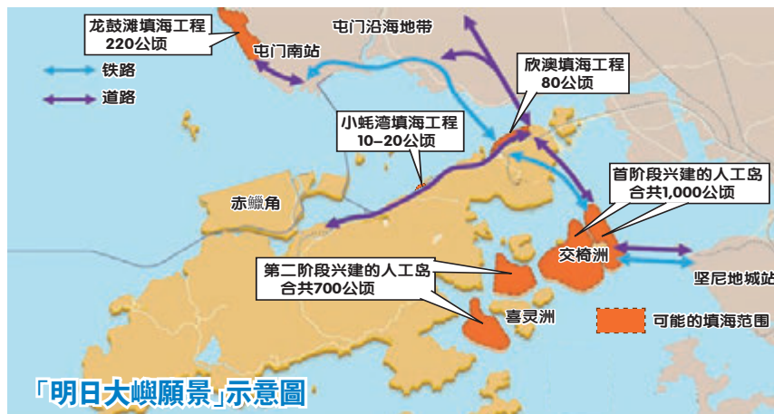
「明日大嶼願景」示意圖

消息人士透露，將爭取研究和設計工作的撥款於未來數月後提交至立法會，盼於2019年中開始技術性研究。政府將會盡力減省程序，務求在5年內，即2025年展開首階段第一部分的填海工程，在大嶼山以東、交椅洲一帶建造300公頃的人工島，預計相關住宅單位可在2032年入伙，連接港島、人工島及屯門的公路