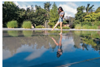
■原來是個露天泳池改為嘻水舞台，還是天空之鏡。