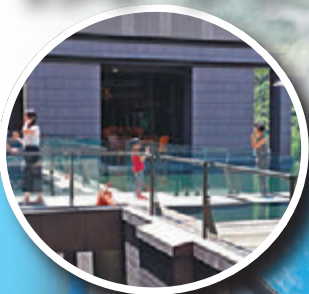
■北投麗禧溫泉酒店的水舞台是住客的打卡點。

北投溫泉是台灣溫泉文化的起源地，因為日本侵佔台灣時日軍找到北投溫泉區作為軍人療養之地，可見泉水之好，漸漸台灣人也懂泡溫泉去北投。愈來愈多日本人到此泡湯，形成許多湯屋都具東瀛風格。上世紀60年代的北投，是個燈火輝煌、夜夜笙歌的風華年代，在新北投的溫泉鄉無數條錯綜複雜巷弄小道聚集了不少財富、榮耀與地位的人。事實上，北投溫泉的泉水是從最近距離的泉眼中來，可謂貨真價實。除了泡湯，周邊景點北投文物館、張學良故居（現時取名“少帥禪園”）、陽明山國家公園、紗帽山溫泉、地熱谷、關渡宮、關渡自然公園自行車道、北投溫泉博物館、北投溫泉圖書館、草山國際藝術村、陽明書屋、絹絲瀑布……等，而最新的陽明山上秘景——美軍俱樂部更是值得一遊。