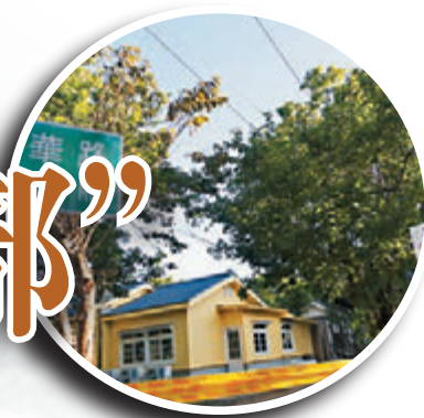
■位於陽明山的美軍俱樂部