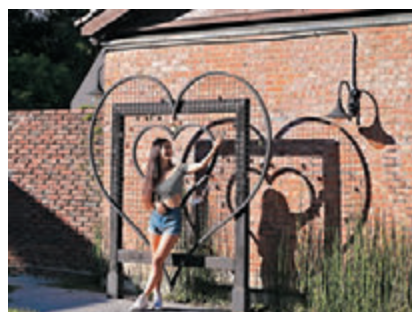
■美軍俱樂部室外談情之地