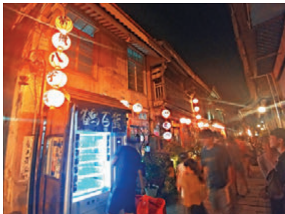
▲夜幕下的神农街，如梦如幻

天气开始好转，我重新踏上往台东的行程，顺道逛一下高雄市立美术馆。刚好遇到一个关于眷村的短期图片展，目光竟然不想离开。那不是什么美照，而是一张张破落房子与落寞老人家的照片。数十年前，军队及其眷属被临时安置于日人撤出之营房、校舍或民房等简陋而狭小的空间，因为种种历史及政治因素，他们的生活多年来并没太大变更与改善，但居民还是刻苦耐劳地过日子和养育下一代，形成了台湾独特的眷村文化。只是面对城市发展，他们应该何去何从？毕竟当年的陌生落脚点，现已成为满载感情与回忆的家园，比起真正的家乡更令居民依依不舍。除了粗暴拆村，难道没有更人性化的发展路向吗？