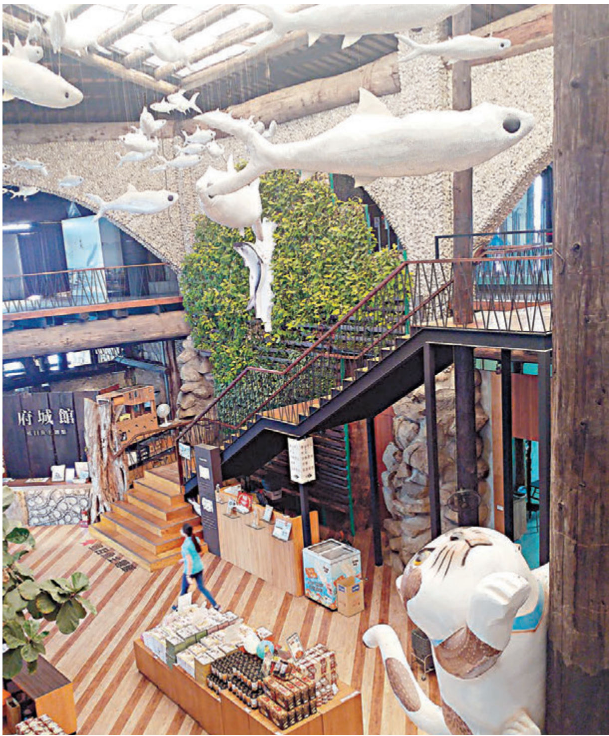
▲虱目鱼主题馆以猫咪作装饰，十分趣致

闪生辉的树影，就觉得“绿色之眼”这个名字更贴切。导赏员不住讲解两岸的生态环境，我最记得却是游人们意外用手机喂鱼的故事。语音刚落，身旁乘客的围中就吹到水面，我弯腰伸手帮忙扶住，身后却感到有东西在推我，其他人微微惊呼，原来是长得低的树枝作怪，算是有点惊险。