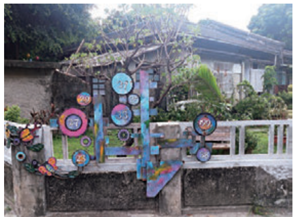
▲三三一巷艺术聚落一隅

这趟本来打算到台东探朋友，没料到天气骤变，于是临时转向先到台南。下火车之际还带点睡眠惺忪，未认真思考去向，台南文化创意产业园区就现于眼前。奈何碰上星期一休息，四周只有零星游客跟这座有日治时期建筑特色的红砖古迹拍照，拖着行李箱的我显得特别怪异和吵耳。