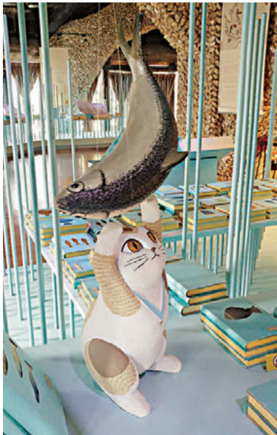
▲虱目鱼主题馆有一头“馋嘴猫”