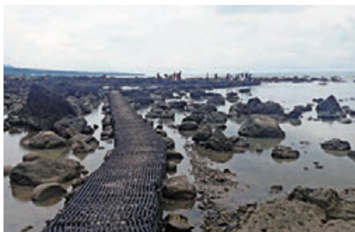
▲富山渔业资源保育区