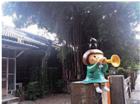
▲三三一巷艺术聚落里的吹笛女孩，可爱极了