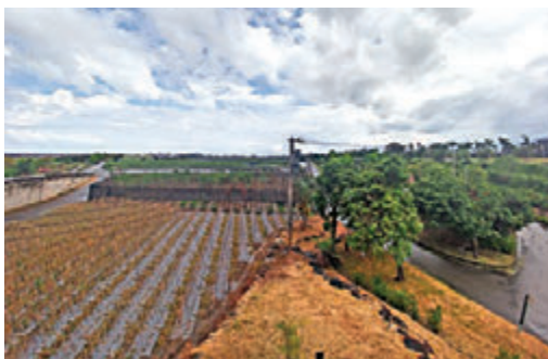
▲蓝天白云下的稻田，赏心悦目