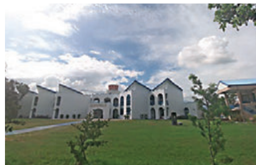
▲洋溢希腊爱琴海风情的小学

在台南的第一晚，手机响个不停。台东朋友早就为我的来临准备海鲜烧烤大会，结果我表示“不想在室内躲雨，要改去台南”，就落得只能看海鲜照片的下场。我到台东之后，朋友偕女儿陪我吃火锅和冬甩，某程度上也算弥补了遗憾。