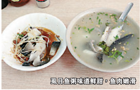
虱目鱼粥味道鲜甜，鱼肉嫩滑