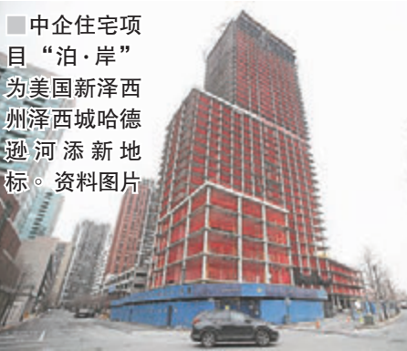
中企住宅项目“泊岸”为美国新泽西州泽西城哈德逊河添新地标。

另据报道，中国驻休斯敦总领事馆总领事李强日前表示，中美经贸关系的本质是互利共赢，平等协商是解决经贸摩擦的唯一正确选择。李强日前在休斯敦举行的一个论