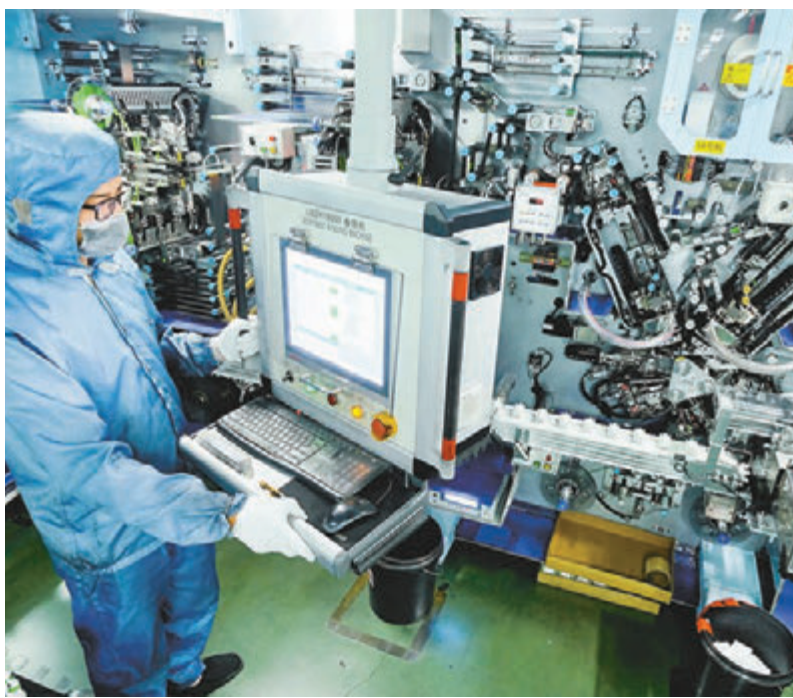
图：江苏盐城一家制造型企业内的生产景象。

此外，对于近期人民币汇率下滑，刘爱华分析，人民币汇率主要受到美国加息的影响，中长期来看，近一个月主要货币的贬值态势与人民币走势基本一致。中长期则回归到基本面，目前中国经济运行总体平稳，有利于人民币汇率在合理均衡的水平上保持基本稳定。