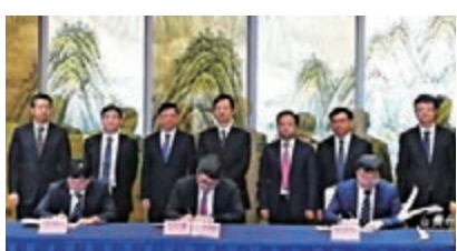
貴州省銅仁市與美國超級高鐵路公司19日在貴陽簽約。

根據協議，銅仁市政府與HTT公司將分別以1:1的出資比例在銅仁市成立合資公司，共建「真空管道超級高鐵路研發產業園」項目。項目建設分為兩個階段：前期雙方將共同建設一條不超過10公里的商業真空管道超級高鐵路；隨後雙方利用第一階段成果，完成相關必要的規章和規定，在此基礎上延長該線路，使長度適用於商業運營。而在該項目上產生的有關真空管道超級高鐵路設計、開發、建設、實施、運營、維護或其他開發或商業化過