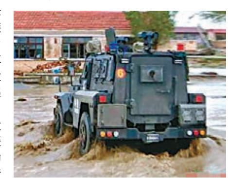
圖為救災現場。

和空中的密切協同配合，在確保受災村民都已安全轉移的情況下，救援隊才撤離現場，成為當天多支搶險救援隊中最後離開受災村莊的隊伍。