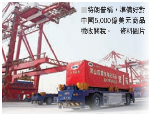
特朗普稱，準備好對中國5,000億美元商品徵收關稅。資料圖片

他認為，按照美國經濟周期運行規律，在沒有大規模貿易戰干擾的情況下，美國經濟結束當前的景氣，步入蕭條應該是在2020年前後，大規模貿易戰或許會推動美國大蕭條的提前到來。