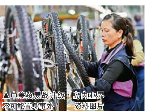
▲ 中美贸易战升级，岛内业界不可能置身事外 资料图片

百达资产管理公司根据各国与全球价值链的整合程度排名，列出贸易战火下的 10 个经济重灾区，台湾名列第二。据报道，岛内