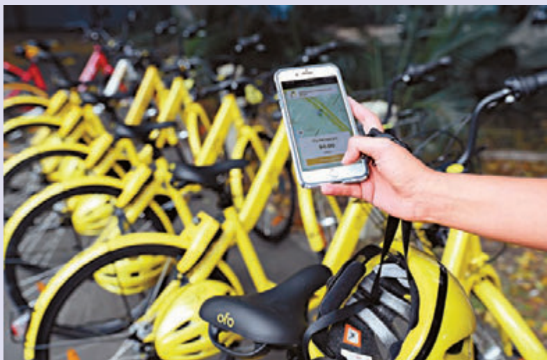
▲ ofo 宣布，将在未来 60 天逐步撤出澳洲阿德莱德和悉尼的业务

据科技日报引述评论分析指，共享单车市场上，免押金操作已不新鲜。免押金降低了使用成本，在一定程度上可为平台争取更多用户。但来到“下半场”，仅靠免押金抢用户是远远不够的。如果说“上半场”比拼的是用户规模、资本“粮草”，那么到了“下半场”竞争的焦点就要从“数量”转移到“质量”上来——提高运营管理的效率、摸索出“自我造血”的盈利模式。只有这样，共享单车才能走上良性发展之路，使这种共享模式在市场上拥有生存的能力。