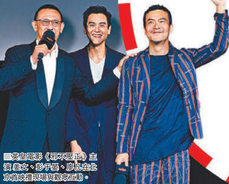
英皇電影《邪不壓正》主演姜文、彭于晏、廖凡在北京首映禮現場與觀眾互動。

姜文自言一直尊重女性，“從第一部電影開始，我就把女人當作神來拍，我仰視女人。”太座至上，他也沒忽略愛兒，《邪不壓正》正是為兒子而拍，“之前我突然發現，以前所拍的電影，除了《陽光燦爛的日子》，我兒子基本沒看過，那個時候他不到十歲，我對兒子說：‘好，我用四年拍個電影。’四年磨一劍，不會太長嗎？姜文回應：‘你把時間獻給好玩的事兒，又不急着搶錢，電影票價是不能動的，我只能物美了，所以我用了四年拍了這個。’