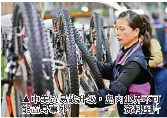
中美贸易战升级，岛内业界不可置身事外。资料图片

据“关键评论网”报道，贸易战对经济成长高度仰赖外贸的台湾而言自然是一大警讯。特别是美国持续升息，刺激全球资金回流，新兴市场近期成为外资“提款机”，如今增添美中互祭高关税这个变数，台湾更是压力倍增。尤其美国加征关税对象锁定中国大陆科技