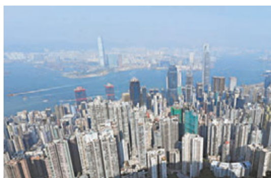
香港政府辣招收入半年及季度新高

香港税务局11日公布最新的办招税入，上月来自额外印花税（SSD）、买家印花税（BSD）、双倍印花税（DSD）及新住宅从价印花税（NRSD）的总收入超过55.68亿元，按月飙升约60.7%，是自政府2010年底开始推出辣招税SSD，及其后几年不断加入BSD、DSD及NRSD其他新税种后，上月是收入新高纪录。