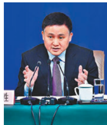
中國人民銀行副行長兼國家外匯管理局局長潘功勝。資料圖片

據《第一財經》報道，潘功勝在一論壇上指出，人民幣資本項目的開放目前存在着可兌換程度較低、便利性不高和交易環節約束較多等問題，因此，要從完善優化合格機構投資者制度等四個方面推進部署人民幣資本項目開放。四方面分別為：推動金融市場雙向開放，增加金融市場產品供給；完善優化合格機構投資者制度；完善互聯互通機制，擴大產品覆蓋範圍；以及支持金融機構參與國際金融市場，以推進部署人民幣資本項目開放。