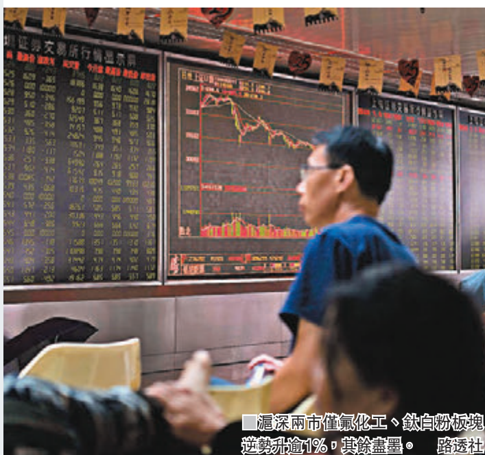
滬深兩市僅氟化工、鈦白粉板塊逆勢升逾1%，其餘盡墨。