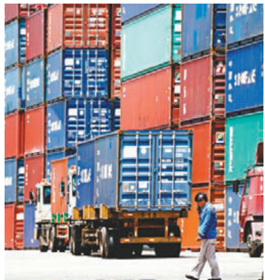
美國佔中國外銷比重的19%。

香港文匯報訊 美國公佈新關稅清單，將對2,000億美元的中國商品加徵10%關稅。外電引述多位專家指出，新一波關稅商品經過精心挑選，以免「傷人不傷己」。清單上的部分項目明顯是針對「中國製