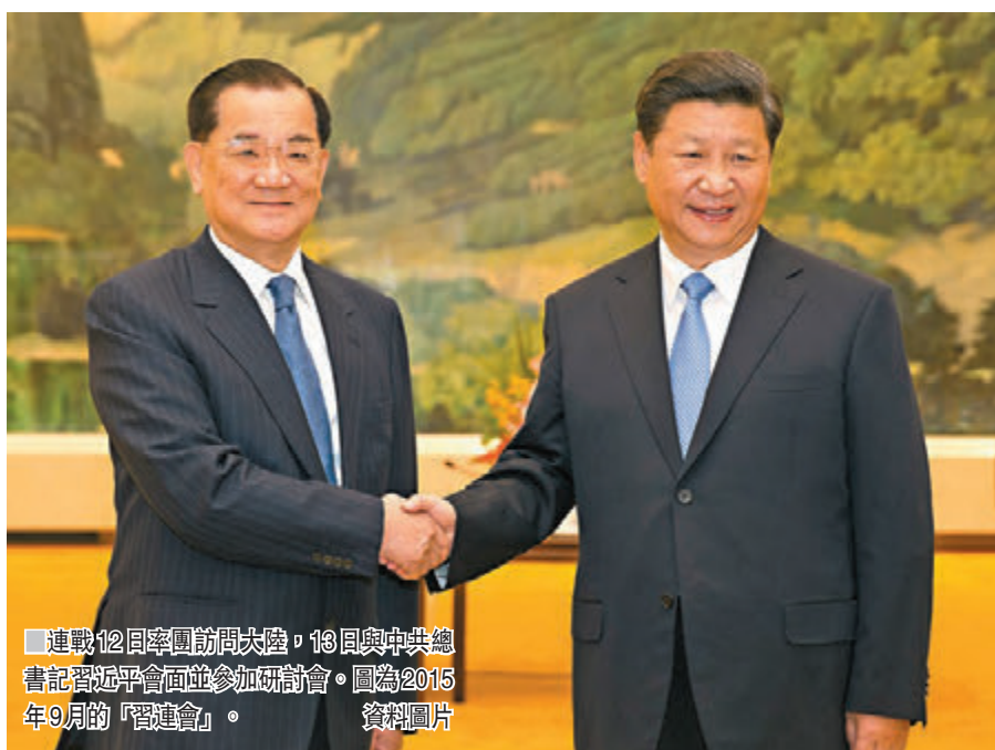
連戰12日率團訪問大陸，13日與中共總書記習近平會面並參加研討會。圖為2015年9月的「習連會」資料圖片。

香港文匯報訊（記者 朱燁 北京報導）中國國民黨前主席、兩岸和平發展基金會董事長連戰12日率團訪問大陸，島內「獨」派團體抹黑此行是「裡應外合出賣台灣」。對此，中國社會科學院近代史研究所台灣史研究室研究員褚靜濤對香港文匯報表示，「台獨」分子對連戰訪陸氣急敗壞，他們想破壞、阻撓、「誣衊化」此次訪問，屬於一貫伎倆，但這一小撮「台獨」勢力不會得逞，最終被兩岸和平發展的大潮所拋棄。他強調，堅持「九二共識」才能為台灣人民帶來真正的利益。