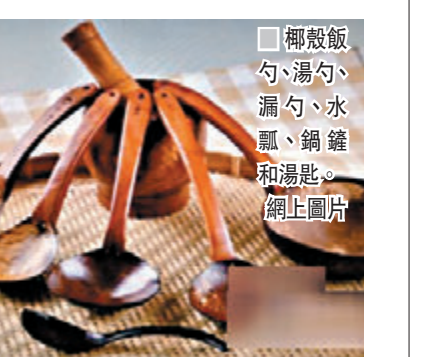
椰殼飯勺、湯勺、漏勺、水瓢、鍋鏟和湯匙。

湯匙。2012年，他為自己的椰殼廚具申請了專利。後來，他申請註冊了「小椰殼」商標。