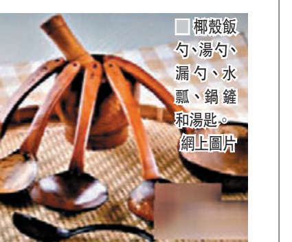
椰殼飯勺、湯勺、漏勺、水瓢、鍋鏟和湯匙。

湯匙。2012年，他為自己的椰殼廚具申請了專利。後來，他申請註冊了「小椰殼」商標。