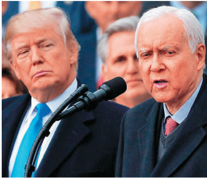
美國共和黨參議員、參議院財政委員會主席哈奇(右)批評特朗普升級貿易戰的舉動魯莽。

官方稱進行「必要反制」，還意味着中國的回擊將建立在充分考慮國內產業所受影響的基礎上，不會不計後果。