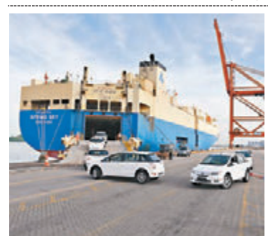
深圳大鏡灣整車出口口岸12日首次以滾裝船的方式出口汽車，百輛比亞迪e6電動汽車通過滾裝船「春天天空」號運往泰國。

針對手機不明扣費、垃圾短信、騷擾電話等問題，中國工業和信息化部11日發佈消息稱，已組織相關通信管理局、各基礎電信企業着手開展工作，對相關灰色利益鏈條上的違法違規行為，工信部將積極配合有關部門依法進行處置。