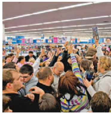
美國零售商領袖協會批評新一輪關稅措施已影響一般消費者。圖為美國民眾早前在沃爾瑪搶購貨品。

香港文匯報訊 據中新社報道，在美國政府10日宣佈擬對2,000億美元進口自中國的商品加徵關稅的清單後，美國多個主流媒體、議員和行業協會對此表示擔憂，稱其「魯莽」，擔心美國自食其果。