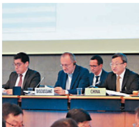
中國商務部副部長、國際貿易談判副代表王受文(右)代表中方發言。

香港文匯報訊 據新華社報道，世界貿易組織11日開始對中國進行第七次貿易政策審議。率團參加此次審議的中國商務部副部長、國際貿易談判副代表王受文在當天的審議會上介紹了自2016年7月上次審議以來，中國在貿易投資領域的新進展、主要改革和對外開放措施，以及積極參與多邊貿易體制、發揮負責任大國作用的有關情況。