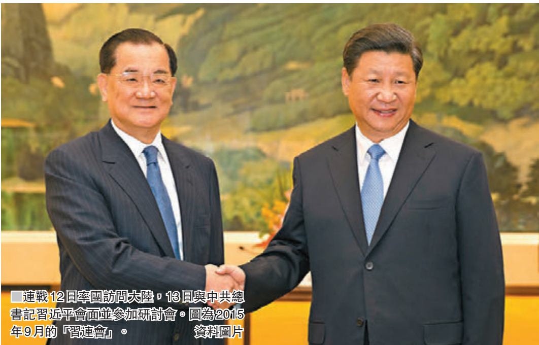
連戰12日率團訪問大陸，13日與中共總書記習近平會面並參加研討會。圖為2015年9月的「習連會」資料圖片。

香港文匯報訊（記者 朱燁 北京報導）中國國民黨前主席、兩岸和平發展基金會董事長連戰12日率團訪問大陸，島內「獨」派團體抹黑此行是「裡應外合出賣台灣」。對此，中國社會科學院近代史研究所台灣史研究室研究員褚靜濤對香港文匯報表示，「台獨」分子對連戰訪陸氣急敗壞，他們想破壞、阻撓、「誣讒化」此次訪問，屬於一貫伎倆，但這一小撮「台獨」勢力不會得逞，終將被兩岸和平發展的大潮所拋棄。他強調，堅持「九二共識」才能為台灣人民帶來真正的利益。