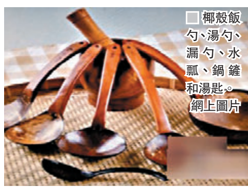
椰殼飯勺、湯勺、漏勺、水瓢、鍋鏟和湯匙。

湯匙。2012年，他為自己的椰殼廚具申請了專利。後來，他申請註冊了「小椰殼」商標。