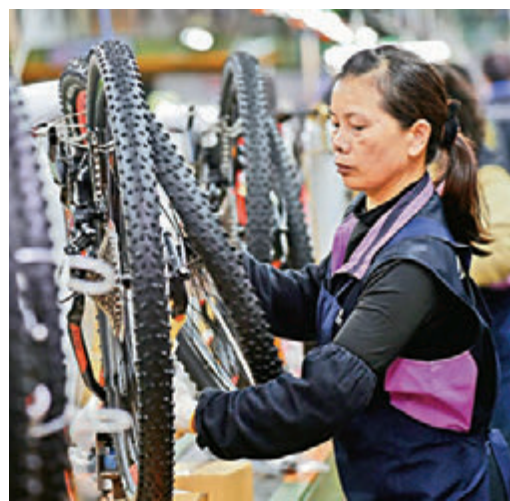
▲中美貿易戰升級，島內業界不可能置身事外 資料圖片

百達資產管理公司根據各國與全球價值鏈的整合程度排名，列出貿易戰火下的10個經濟重災區，台灣名列第二。據報道，島內中華經濟研究院日前對台灣製造業進行的調查，逾半受訪製造業預期會對公司訂單或營運形成程度不一的衝擊，可能影響三大層面，包括原物料價格攀升、調整採購政策及訂單，或是客戶流失。