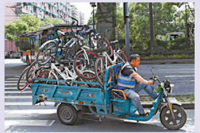
▲一名工作人員正在運送各類共享單車 中新社