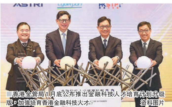
香港金管局1月底公布推出金融科技人才培养计划升级版，加强培育香港金融科技人才。资料图片

在提升科研及人才培养方面，金管局于1月底公布推出金融科技人才培养计划升级版(FCAS