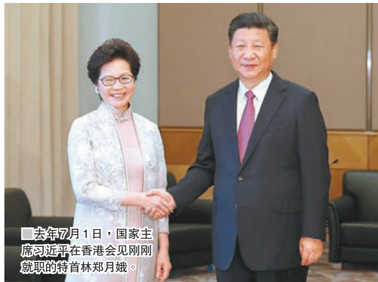
去年7月1日，国家主席习近平在香港会见刚刚就职的特首林郑月娥。