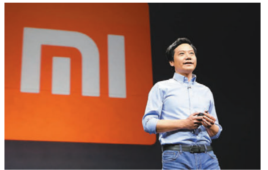
小米将成为首家以不同股权形式上市的港股。图为小米始创人雷军。资料图片

WeLab在去年11月，曾完成了新一轮的股权及债务战略融资，共筹得2.2亿美元资金。当时市场估计，WeLab的市值已攀升至10亿美元（约1.12万亿港元），符合了“独角兽”企业的规模。