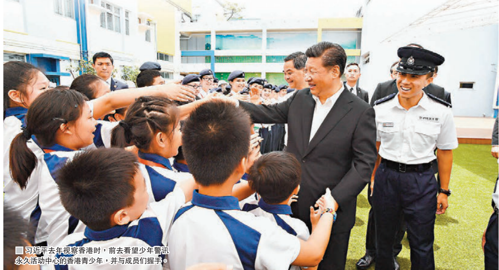
习近平去年视察香港时，前去看望少年警讯永久活动中心的香港青少年，并与成员们握手。