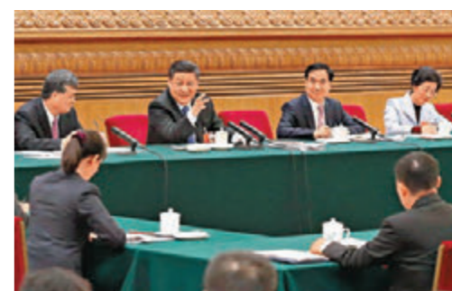
今年3月两会，习近平参加广东团审议，要求粤港澳加快推进湾区建设。

类似看法，“香港过去错过了很多机会，例如泛珠三角发展、前海等与广东省合作的不同方案，推动及发展成效不彰，相信除了是我们香港的问题，也是由于内地方面当时的大局意识不够。”