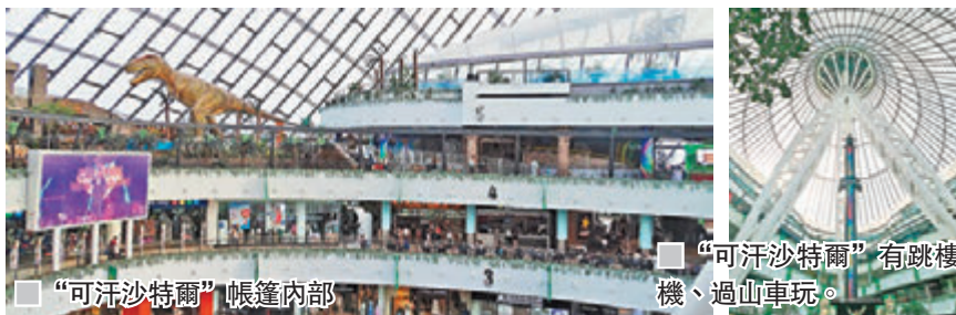
“可汗沙特爾”帳篷內部

之城。城市建築風格更是令人驚喜，也表現出一種多元文化並存的氣息。阿斯塔納城市的老區和新區以伊希姆河為界，北側是古老的，前蘇聯時代的建築，而南部則是政府區和紀念碑，各式各樣特色建築在市內崛起；所以參觀特色建築物必然成為遊覽這個城市的重要節目。