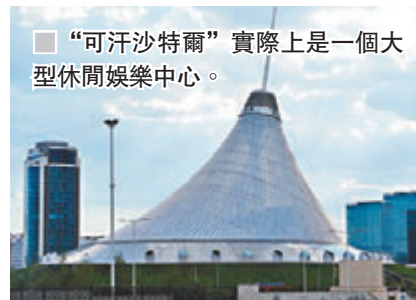
“可汗沙特爾”實際上是一個大型休閒娛樂中心。