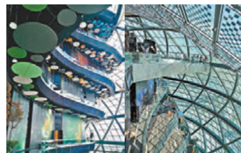
“努爾阿萊姆”球體內有一角凌空，非常驚險，畏高者小心！

從導遊的英文水平和景點設施看舊首都阿拉木圖的旅遊業，較新首都阿斯塔納成熟，哈國文化部部長透露正着力培訓講英語的人才，從學校開始設立英文課程。然而，2017年阿斯塔納舉辦世博會為全世界矚目，來自一百多個國家的400萬遊客到訪阿斯塔納，足以令阿斯塔納更具潛力和自信發展成國際化大都會。