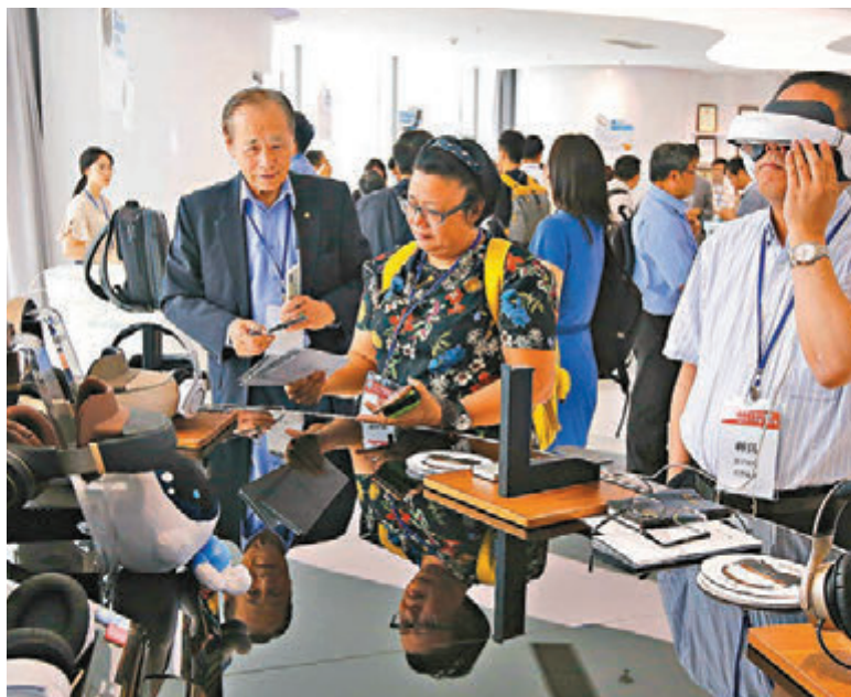
■ 世界中文報業協會赴粵港澳大灣區考察團參觀深圳柔宇科技。日前，柔宇科技投資約110億元人民幣建設的全球首條類六代全柔性顯示屏大規模量產線在深圳正式點亮投產。

可折疊設計的可3D移動影院 Royole Moon、戴在手上的可捲曲穿戴手機 FlexPhone、弧形的柔性汽車中控、可以收縮到鋼筆大小的柔性鍵盤……在位於深圳南山區科技園的柔宇科技展廳，各種全球首創的柔性電子產品，令考察團成員眼前一亮。