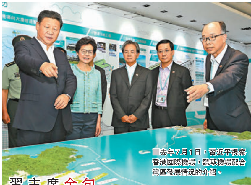
去年7月1日，習近平視察香港國際機場，聽取機場配合灣區發展情況的介紹。