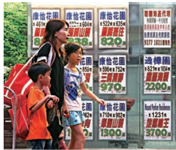
▲楼价今年以来整体已飙升约一成，新界区与港岛区指数更齐齐创新高

【大公报讯】记者赖振雄、林惠芳、实习记者卓铭轩报道：楼价屡创新高，仅2018年约六个月已飙升一成。香港社会响起冤地进行曲，惟半数港人拒奏生育交响曲。香港妇联调查发现，愿意生育子女的港人跌至47%的五年新低，女性拒绝生小孩的比率更首次超越男性。港人不愿传宗接代的五大原因包括房屋问题、育儿经济压力、工作繁忙、享受自由身及托儿服务不足，普遍受访者认为解决房屋问题最关键，希望政府优先安排公屋及居屋，以助增加生育意愿。