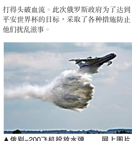
俄别-200飞机投放水弹

俄罗斯足球流氓由于其组织性和纪律性强而成为全球足球暴力中最可怕的力量，曾在2016年欧洲杯赛期间把英国球迷打得头破血流。此次俄罗斯政府为了达到平安世界杯的目标，采取了各种措施防止他们扰乱滋事。