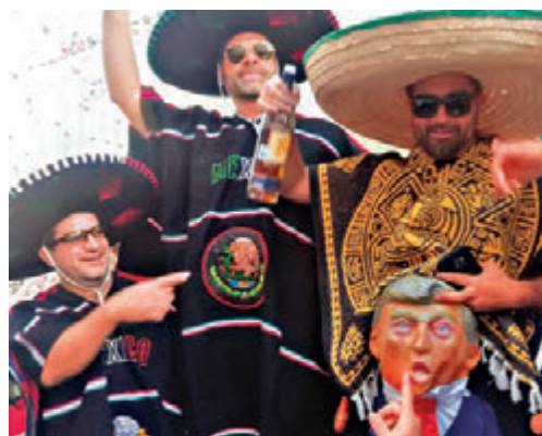
墨西哥球迷下体挂特朗普人像泄愤