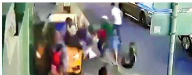
莫斯科的士冲上行人路，连续撞倒多人 资料图片

【大公报讯】据塔斯社、《卫报》报道：16日晚，莫斯科市中心接近红场地段一辆的士突然冲上行人路，导致8人受伤，其中包括两名赴俄观看世界杯的墨西哥球迷。肇事者为吉尔吉斯斯坦公民，事发后企图逃跑，但被路人合力制服。事件一度引发恐袭疑云，但警方随后证实司机为赚钱载客疲于赶路，疲劳中踩错油门引发事故。