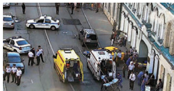
肇事车辆接受检查