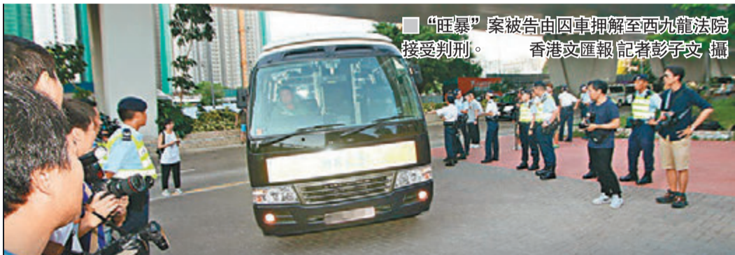
“旺暴”案被告由囚車押解至西九龍法院接受判刑。